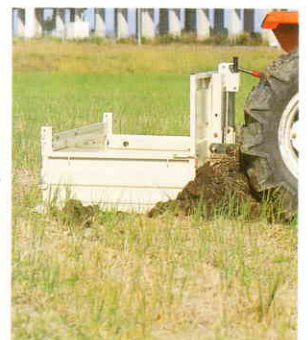
土ならし (スキを格納して前進作業)