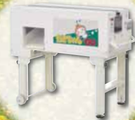
乾燥玉ねぎ調製機