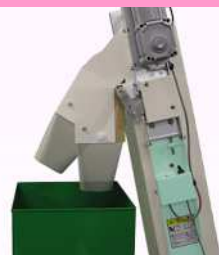
排出口スイング機構