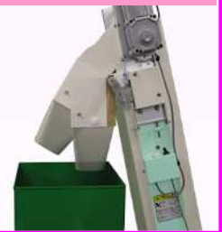
排出口スイング機構