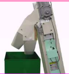
排出口スイング機構