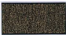
80g (120mℓ) / 箱