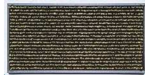
80g (120mℓ) / 箱